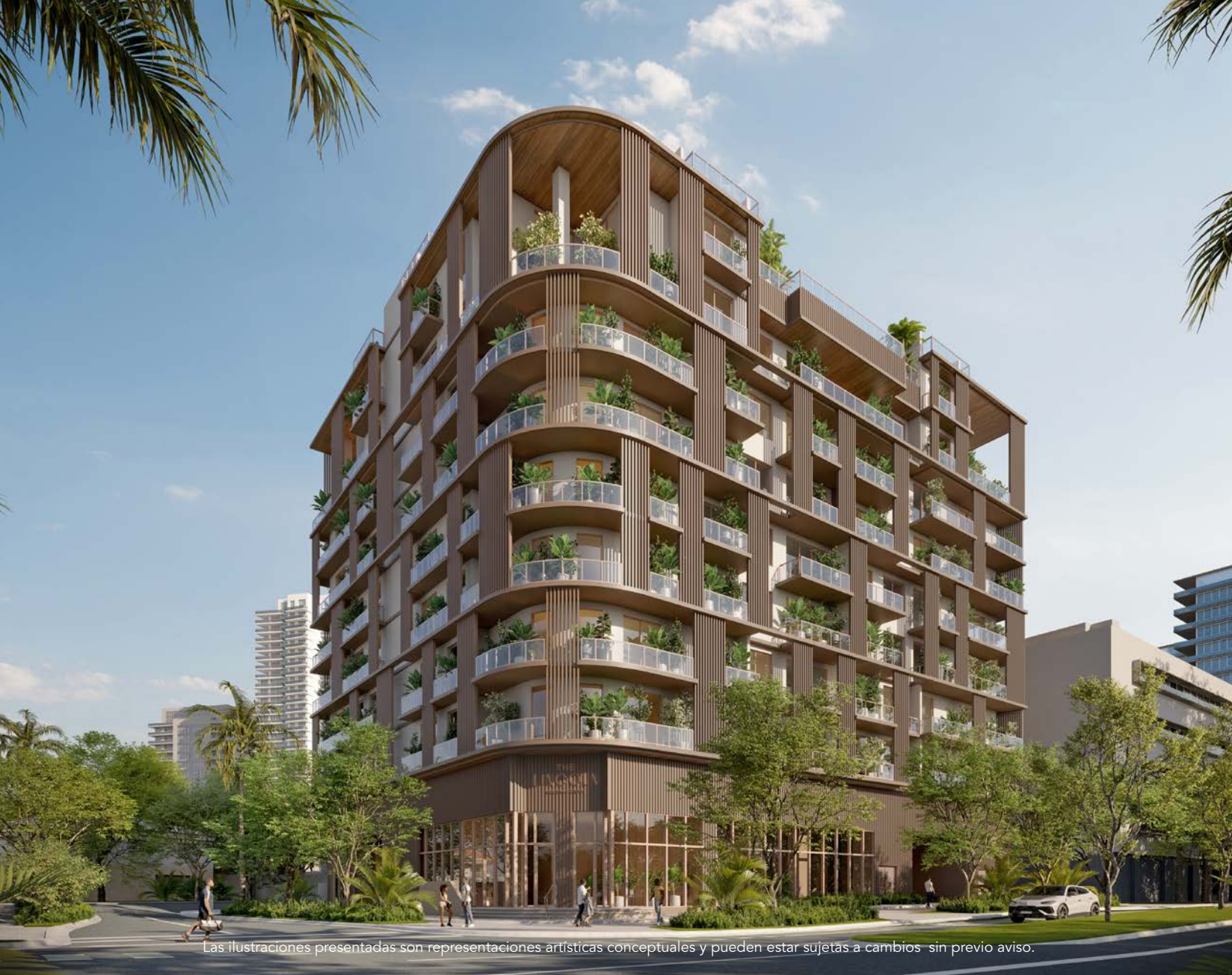
Las ilustraciones presentadas son representaciones artísticas conceptuales y pueden estar sujetas a cambios sin previo aviso.