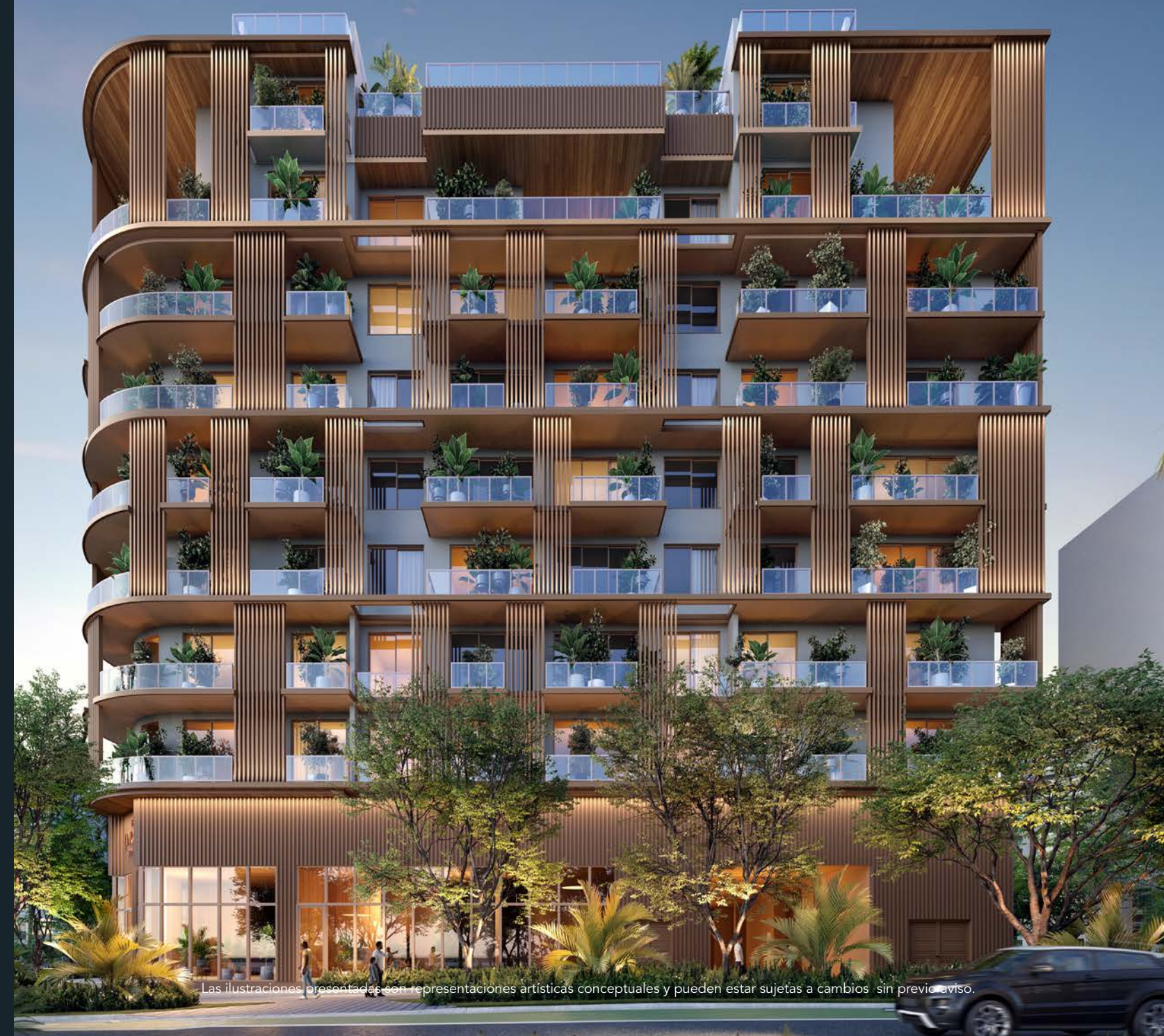
Las ilustraciones presentadas son representaciones artísticas conceptuales y pueden estar sujetas a cambios sin previo aviso.

Una experiencia boutique y exclusiva en el corazón de Coconut Grove