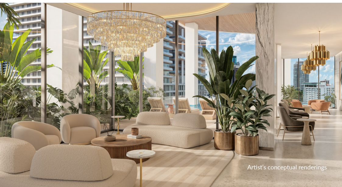
Artist's conceptual renderings