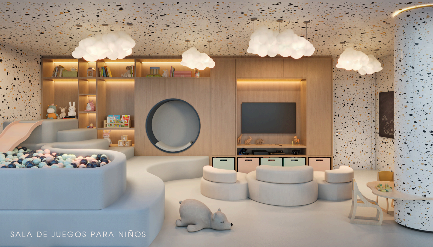
SALA DE JUEGOS PARA NIÑOS