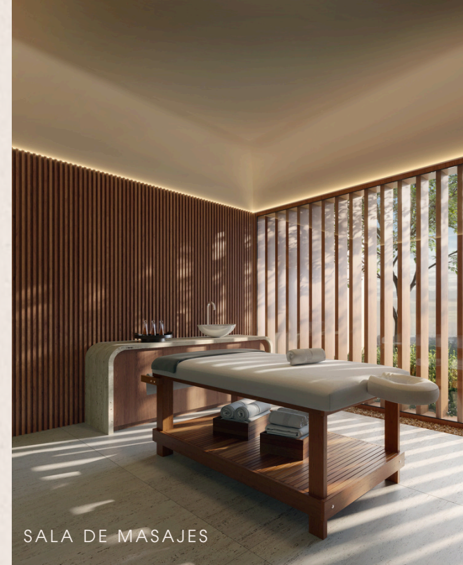
SALA DE MASAJES