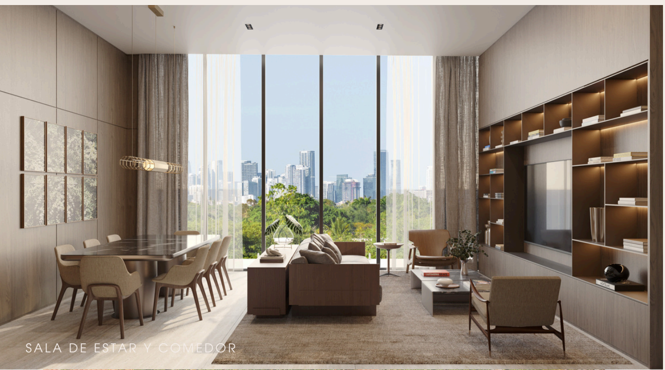
SALA DE ESTAR Y COMEDOR