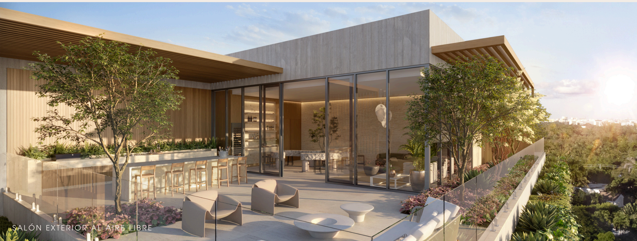
SALÓN EXTERIOR AL AIRE LIBRE