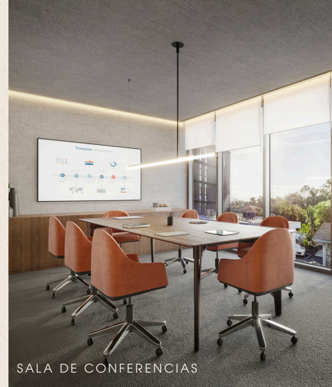
SALA DE CONFERENCIAS