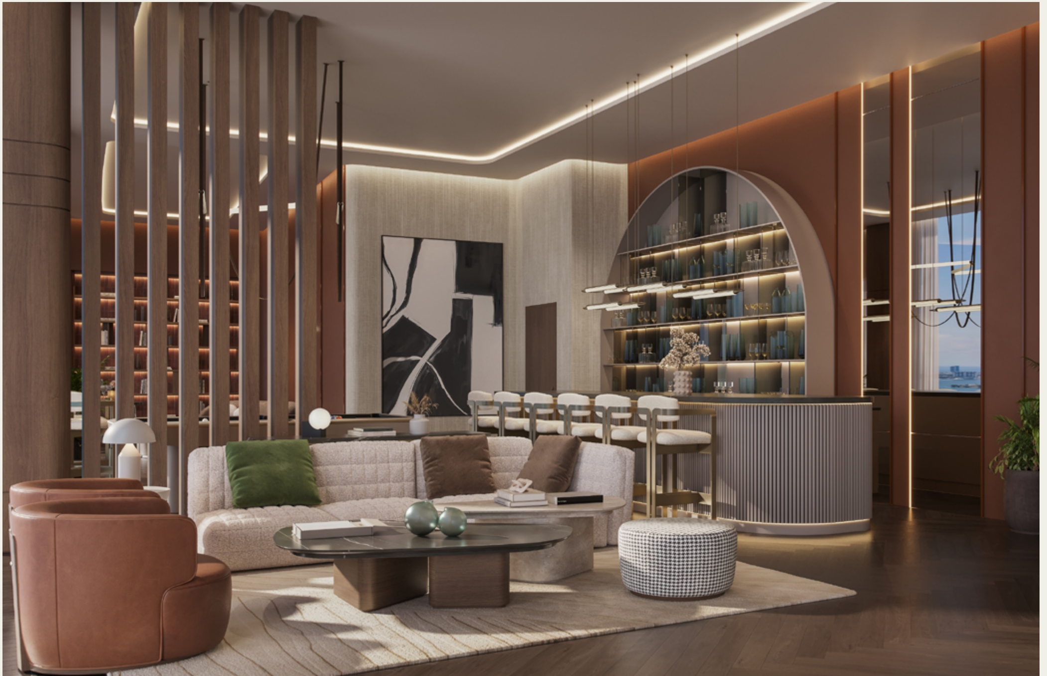
SKY BAR Y LOUNGE