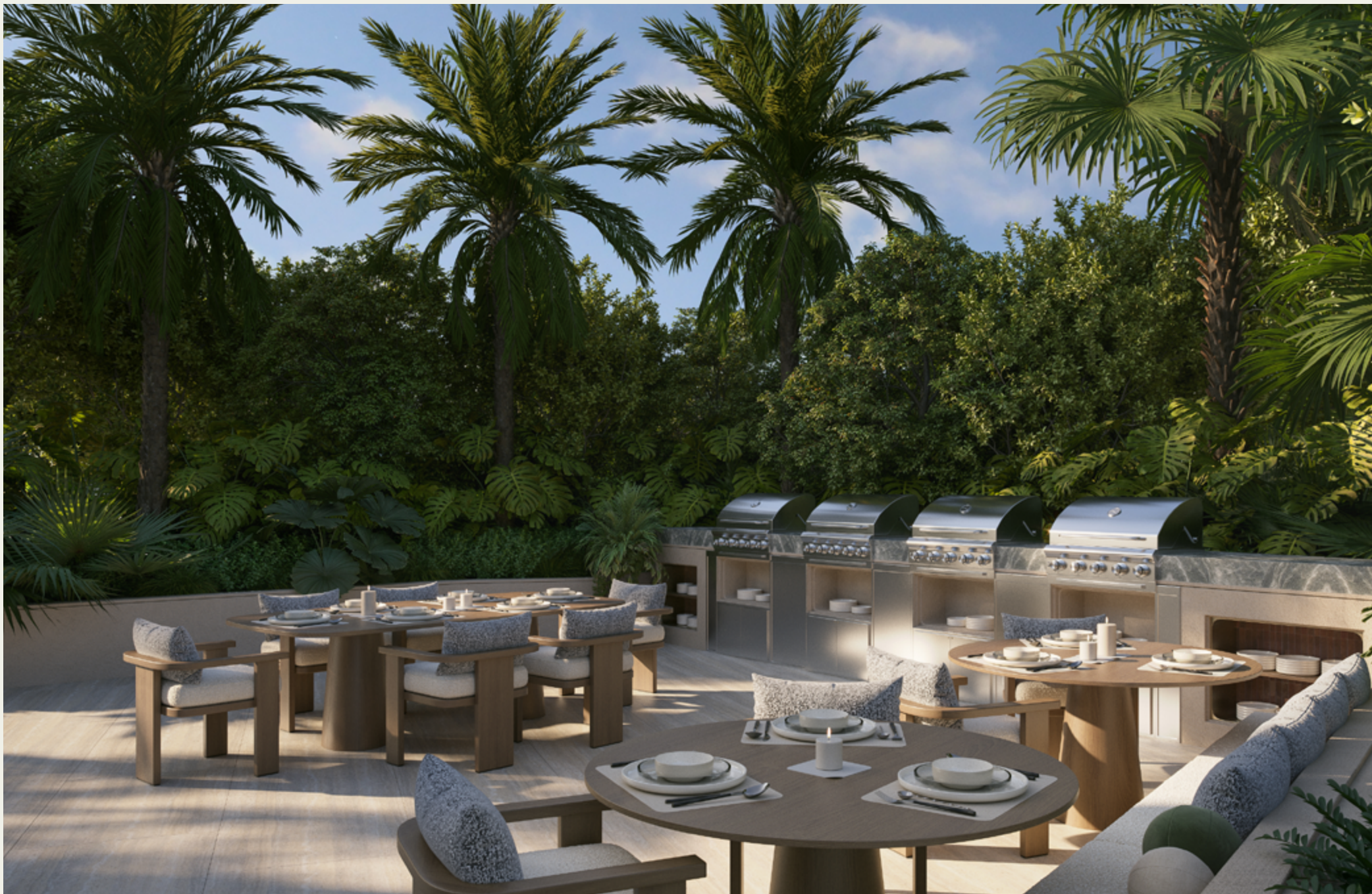
COCINA DE VERANO