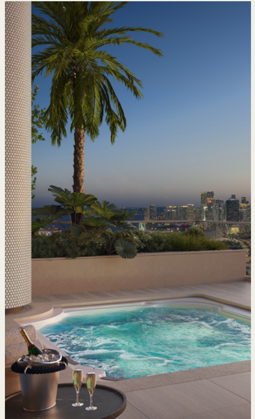
BAR DE PISCINA Y JACUZZI