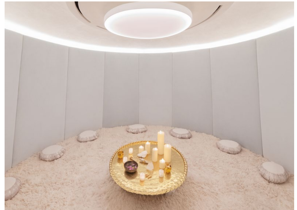
THE WELL New York

Playa Chileno Bay, Cabo San Lucas, B.C.S., Mexico