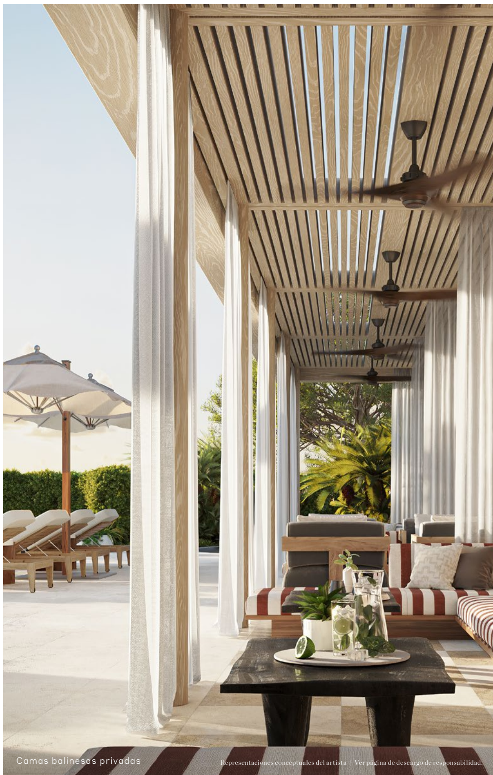
Camas balinesas privadas