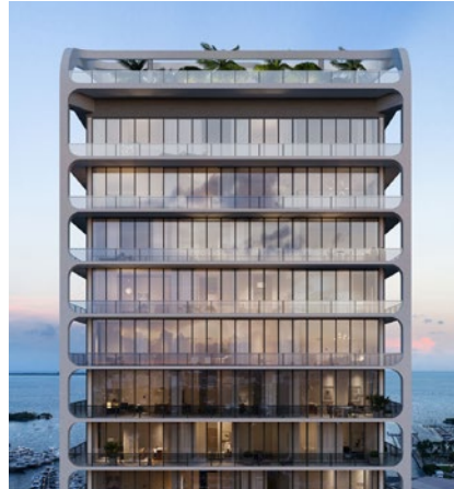
Meyer Davis Mr. C Residences, Coconut Grove, FL