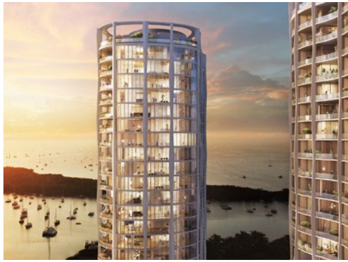
Terra Park Grove, Coconut Grove, FL