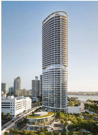
Arquitectonica Five Park, Miami Beach, FL