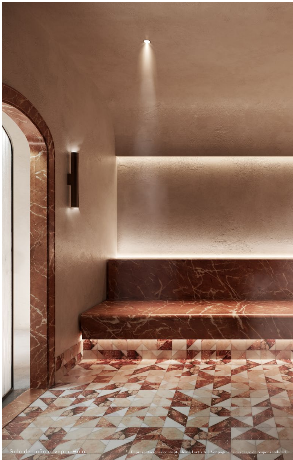
Sala de baño al vapor Halo

Representaciones conceptuales del artista | Ver página de descargo de responsabilidad.