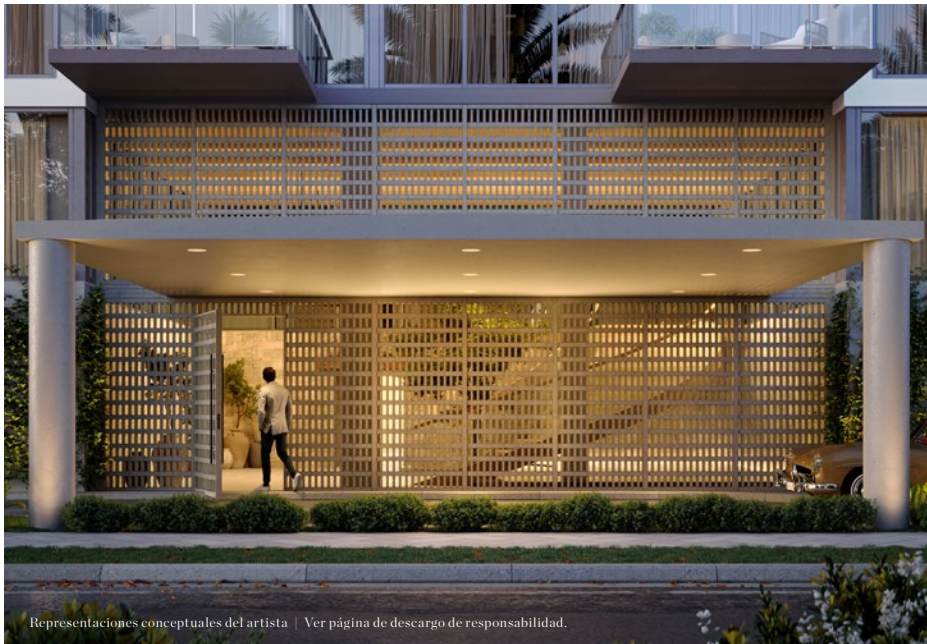
Representaciones conceptuales del artista | Ver página de desargo de responsabilidad.