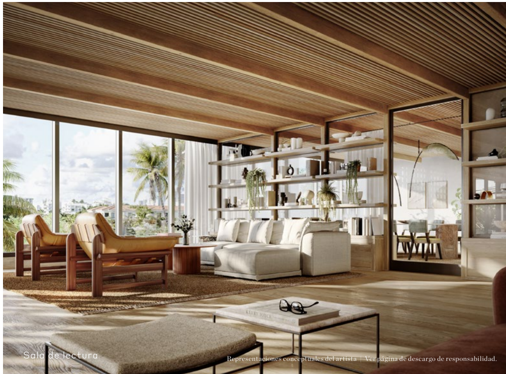
Sala de lectura

Representaciones conceptuales del artista | Ver página de descargo de responsabilidad.