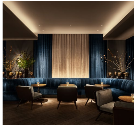
Anda Andrei Design 11 Howard Hotel, NYC